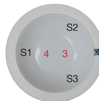
SCN-P360E3.03 Rückansicht - Back view